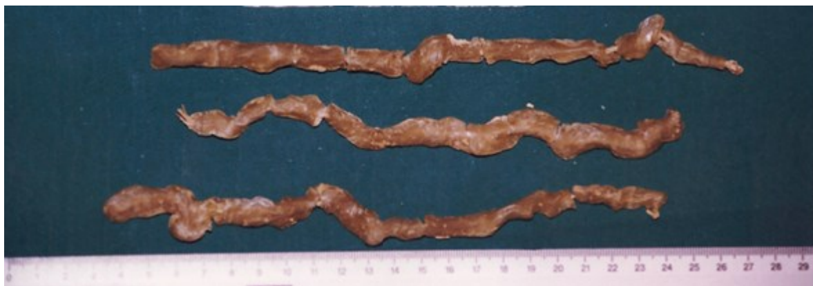
Slika 2. Strana tela - sveće, izvađena operativno iz mokraćne bešike

Na naše zaprepašćenje u bubrežnjaku se nalaze tri zmijolika predmeta, izvijugana, dužine oko 10 cm i debljine oko 10 mm. Bile su to sveće.