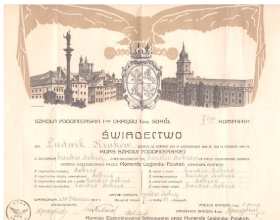
Диплома Лудвика Кракова, Архив Југославије