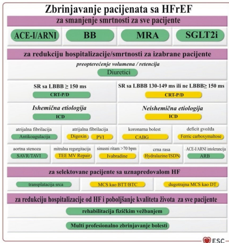
SLIKA 3. Strateški pregled zbrinjavanje pacijenata sa srčanom insuficijencijom i sniženom ejakcionom frakcijom leve komore (HFrEF)