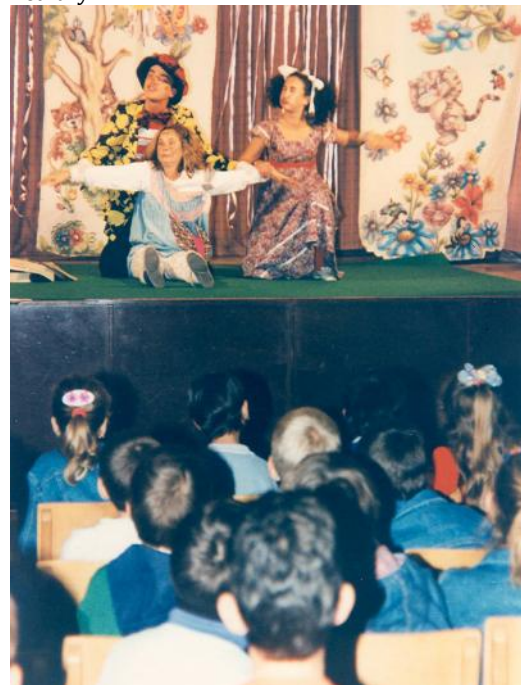
Image 2. Actors of Zajecar Theatre "Zoran Radmilovic" perform the play "I want to be healthy".

Ranije, kada bi neka zdravstvena ekipa dolazila u seosku školu, đaci su se bojali vakcinacija ili pregleda zuba, ili vađenja krvi,