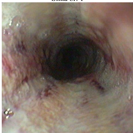
Slika br. 1

Konsultacija ORL: St. post intoxicationem cum Ac. Acetici. Indirektnom laringoskopijom prostor za disanje značajno insuficijentan.